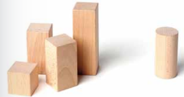
Bild: Wooden cubes (racism) [#13129975]