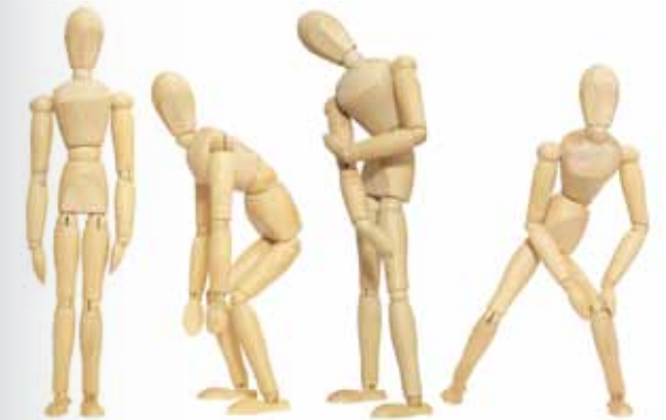
Bild: Mannequin Poses [F18636082]